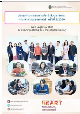
การสื่อสารภายนอก โดยการประชุมคณะกรรมการประจำส่วนราชการคณะฯ