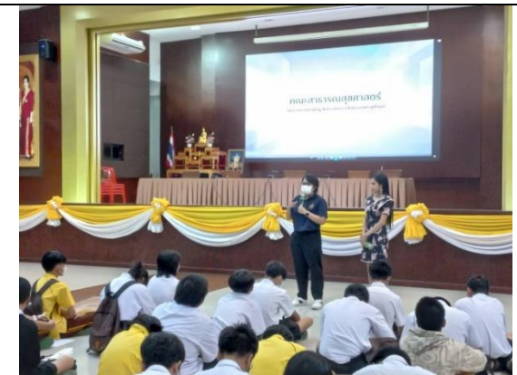
การสื่อสารภายนอก โดยการร่วมกิจกรรมประชาสัมพันธ์ในโรงเรียน