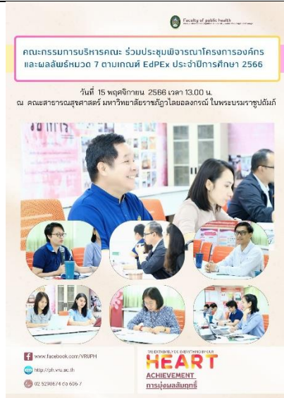
การประชุมเพื่อจัดทำแผนพัฒนากระบวนการรับฟัง ความต้องการของลูกค้ำ