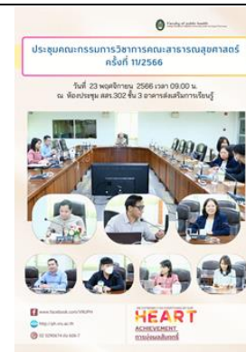
การสื่อสารภายใน โดยการประชุมคณะกรรมการวิชาการและ คณะกรรมการบริหารคณะ