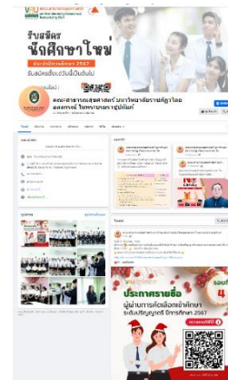
การปรับปรุงสารสนเทศเพื่อการสื่อสารทางออนไลน์