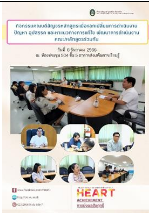
การสื่อสารภายใน โดยการจัดกิจกรรมคณบดีสัญจรหลักสูตร