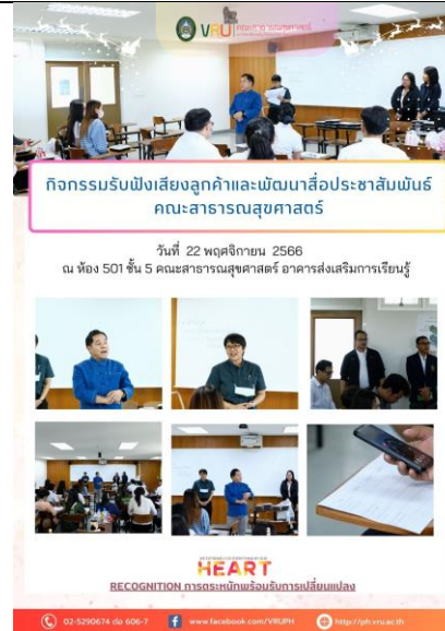
กิจกรรมรับฟังเสียงลูกค้า